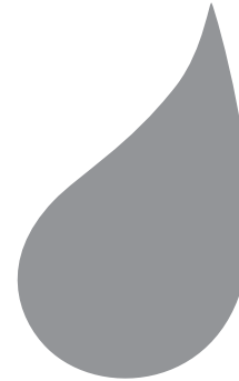
gris logo Serviweb